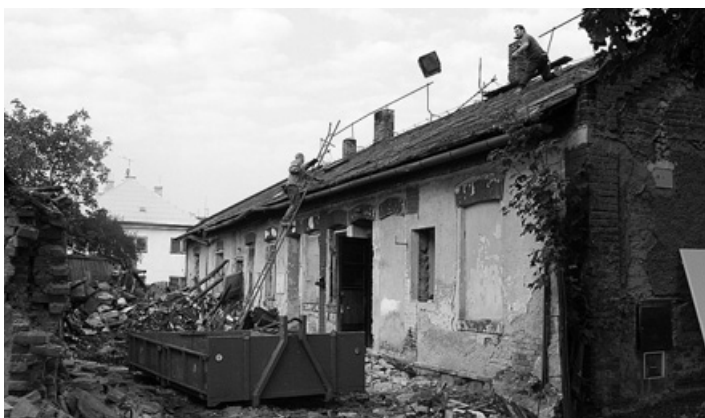
Snímek zachytil demolici v Holešově.