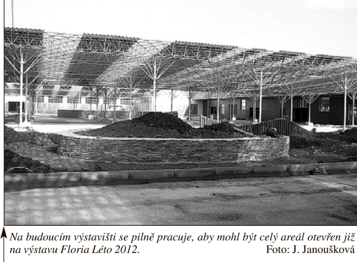
Na budoucím výstavišti se pilně pracuje, aby mohl být celý areál otevřen již na výstavu Floria Léto 2012.

trhy a další. Chci, aby se zde pořádaly i kulturní a společenské akce – divadla malých forem, výstavy atd. Na novém výstavišti k tomu máme zázemí dvou výstavních hal, a tak kryté venkovní přístřešky, což se jistě dá využít pro výstavy i pro kulturní a společenské akce,“ přiblížil své záměry ředitel výstaviště ing. Radek Novotný. A koho zajímá spíše sport, zvláště jízda na in line bruslích, ten bude také spokojený. Celý areál bude totiž běžně přístupný, nejen v době konání akcí. A lidé zde budou moci využívat in line dráhu, ovšem pochopitelně ne v době veletrhů. -ja-