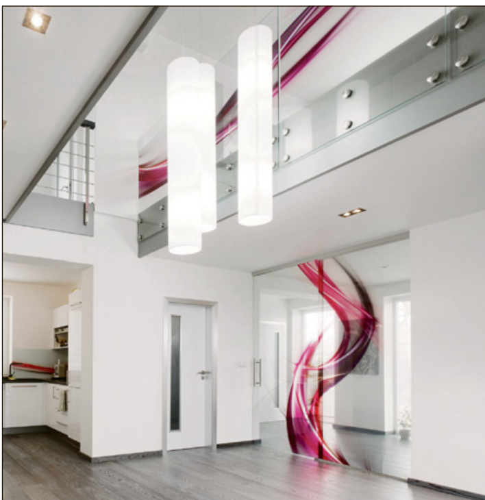
Použití grafoskla nádherně sladí nejen moderní interiér.

Přerov III-Lověšice 67, 750 02 Přerov tel.: 581 201 729 a 606 028 735 e-mail: sklo@sklo-jap.cz