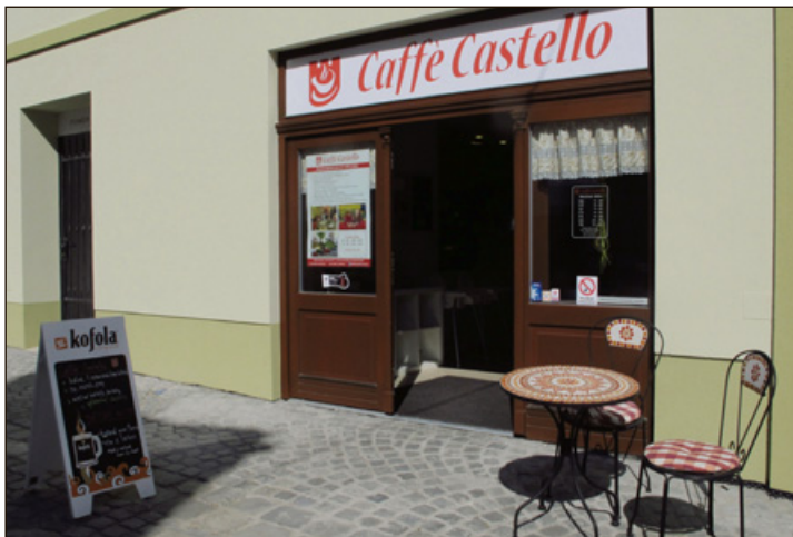
Kavárnu – cukrárnu CAFFE CASTELLO v Kroměříži najdete ve Ztracené ulici.