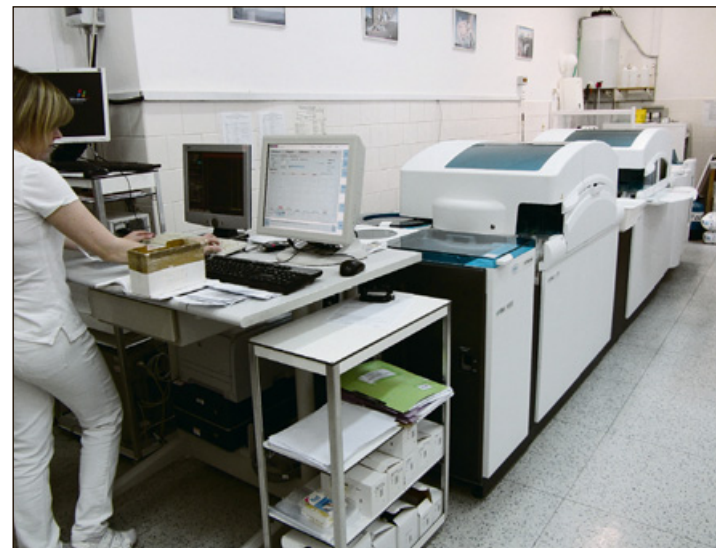
Nový přístroj v laboratoři klinické biochemie a hematologie na poliklinice v Kroměříži patří mezi špičková světová zařízení pro potřeby klinických laboratoří.

Přístroj slouží v naší laboratoři k vyšetření krve a moče v oblasti klinické biochemie a imunochemie, pro potřeby praktických lékařů a ambulantních specialistů bývalého okresu Kroměříž a Kojetínska. -i-