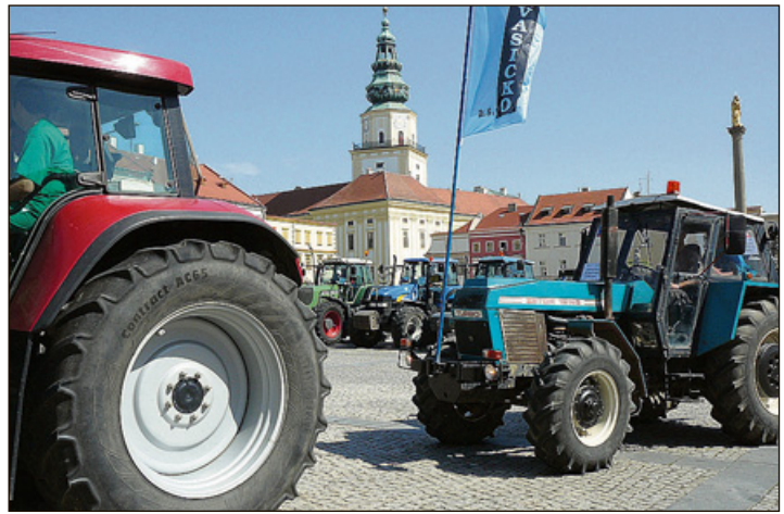
Při protestech zemědělců proti zrušení zelené nafty se Velké náměstí v Kroměříži zaplnilo traktory (více k tématu na 2. straně).

Vítání prázdnin na novém výstavišti Nedávný den otevřených dveří na novém výstavišti Floria v Kroměříži nadchl všechny, kteří se přišli podívat, jak vypadá nové výstaviště, kam se přesunou velké prodejní výstavy Floria z Věžek. A nejen tyto výstavy. Majitelé výstaviště připravili další velkou akci pro veřejnost. „VÍTÁNÍ PRÁZDNIN“ zde proběhne o víkendu 23. a 24. června. „Ake svou náplní naváže na Hrajeme si v Kroměříži, ale navíc zde budou ukázky řemesel, nezapomenutelné divadlo Kjógen, jehož zhlédnutí všem doporučuji, divadlo pro malé Kašpárkovi kamarádi a také různé sportovní ukázky,“ uvedl ing. Radek Novotný. Zvaní jsou děti i dospělí. Prostě všichni, kteří se chtějí pobavit a po-