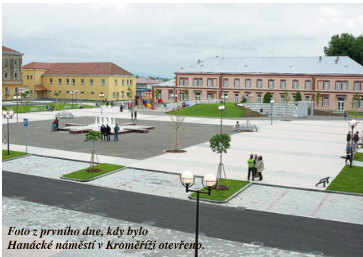
Foto z prvního dne, kdy bylo Hanácké náměstí v Kroměříži otevřeno.

výběr článků naleznete i na www.kromeriz.cz