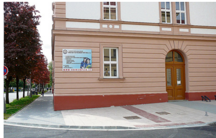
Chodník na Velehradské ulici v Kroměříži. U vjezdu na Hanácké náměstí.

I když tedy přechod je v pořádku, je dobře, že si lidé všimají situace okolo sebe a myslí i na postižené lidi, kterým chtějí pomoci upozorněním na pro ně případnou nebezpečnou situaci. -ja-