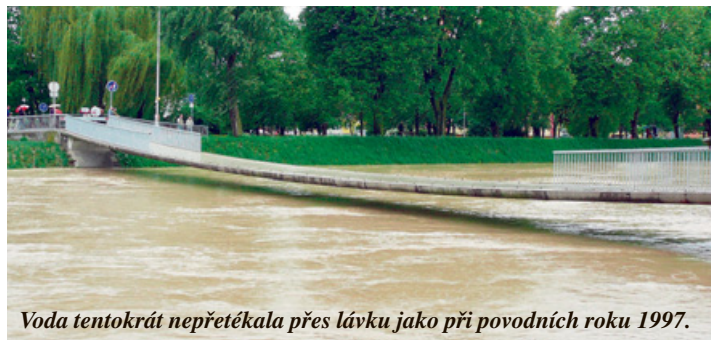
Voda tentokrát nepřetékala přes lávku jako při povodních roku 1997.