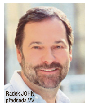
Radek JOHN, předseda VV