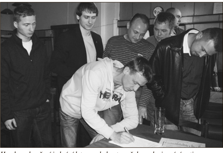
Hned po skončení jednání k trase obchvatu začalo podepisování petice.