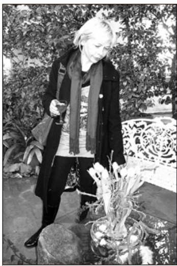
Návštěvníci vernisáže obdivovali nejen krásu kamélií, ale i vazby z jiných květin. Kamélie ve studeném skleníku Květné zahrady jsou různých barev i velikostí, od malých až po několikametrové.